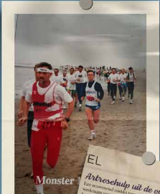
Halve marathon van Monster als extra training voor de Roparun.

Wat ik mij kan herinneren was dit de halve marathon van Schiphol. Zeker weet ik het niet. Wel dat het in 1989 was. Zijn er lopers onder ons die hier wat meer informatie over kunnen vertellen? Ik wacht met spanning op uw reactie.