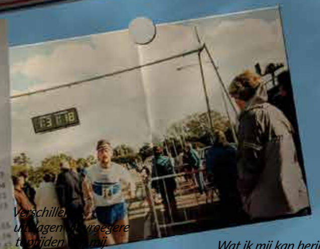
Verschieden uitslagen uit vroegere tijden van mij